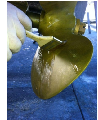
Aplicación de la capa transparente