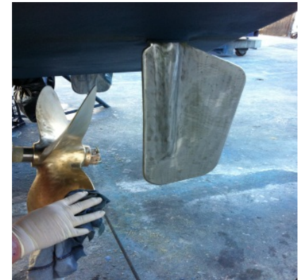
Disolvente de limpieza con un paño